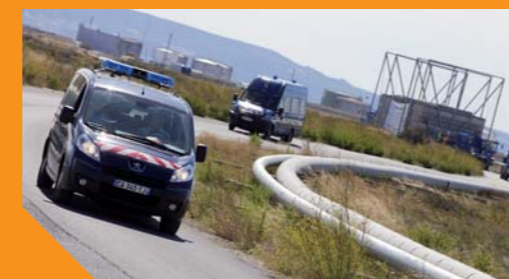
Des convois escortés

Les composants les plus lourds et les plus volumineux (bobines en acier qui mettent en œuvre les dernières technologies, éléments de structure de l'installation de recherche, poutres...) arrivent par bateau au port de Fos-sur-Mer puis sont transportés sur des remorques jusqu'au site ITER à Cadarache (commune de Saint-Paul-lez-Durance).