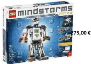
Kit Lego Mindstorms NXT 2.0