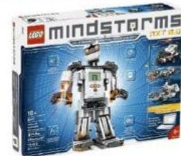
Kit Lego Mindstorms NXT 2.0